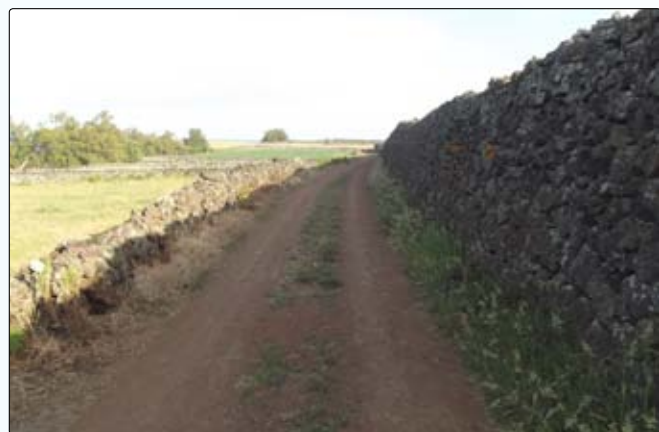
Requalificação da Canada de São Vicente