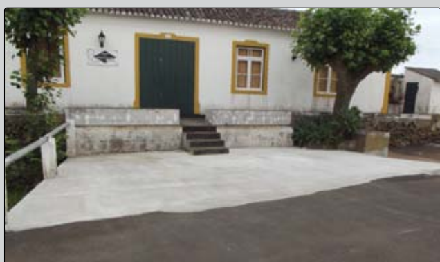
Melhoramento do acesso ao edifício da escola de bordados