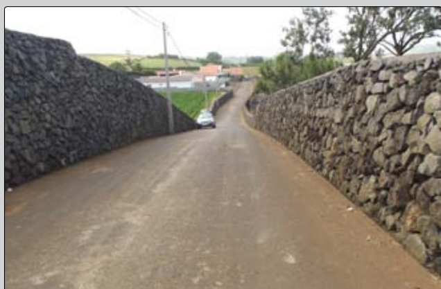
Abertura do Caminho do Tentilhão