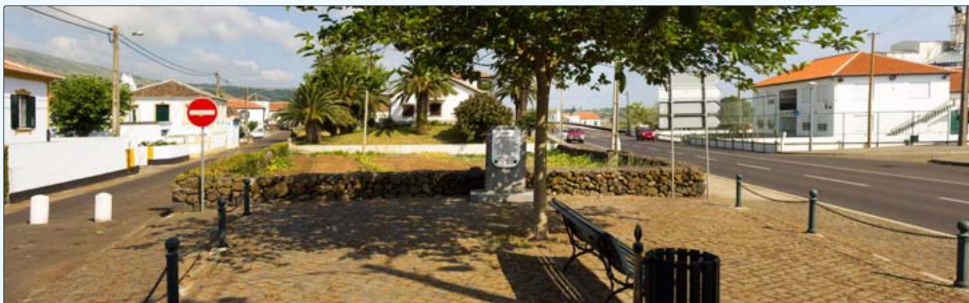
Criação de uma lápide de homenagem aos combatentes falecidos no Ultramar, filhos da freguesia