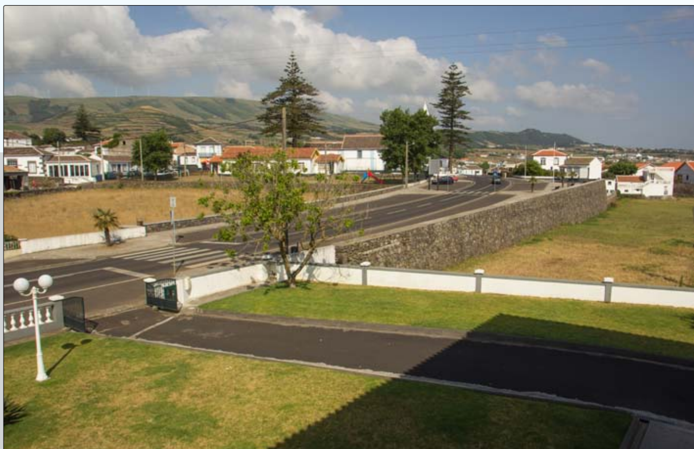
Reabilitação da estrada regional e com ela todo o centro da freguesia