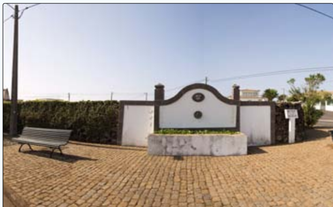
Manutenção do Chafariz no Caminho do Meio