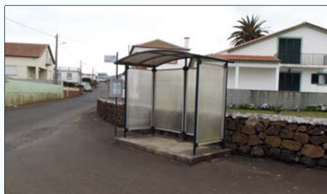
Colocação de novos abrigos de passageiros