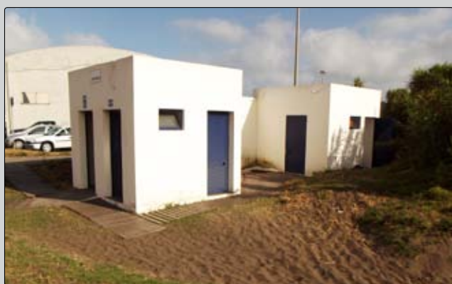
Construção de sanitários e bar na Praia da Riviera