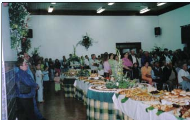
Comemoração do Dia da freguesia