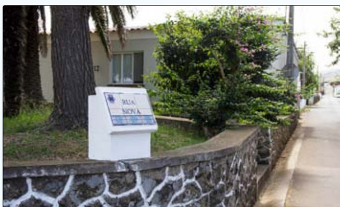
Colocação de placas de identificação de ruas