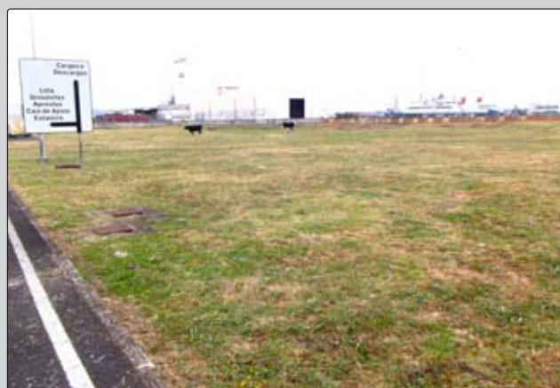
Manutenção da Zona envolvente do Porto de Pescas