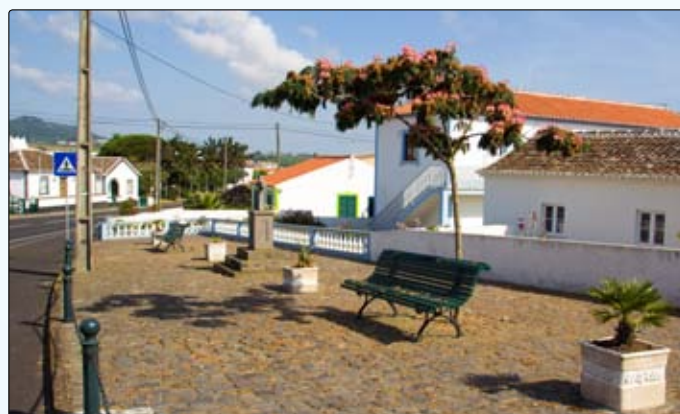
Requalificação do antigo Cemitério da freguesia