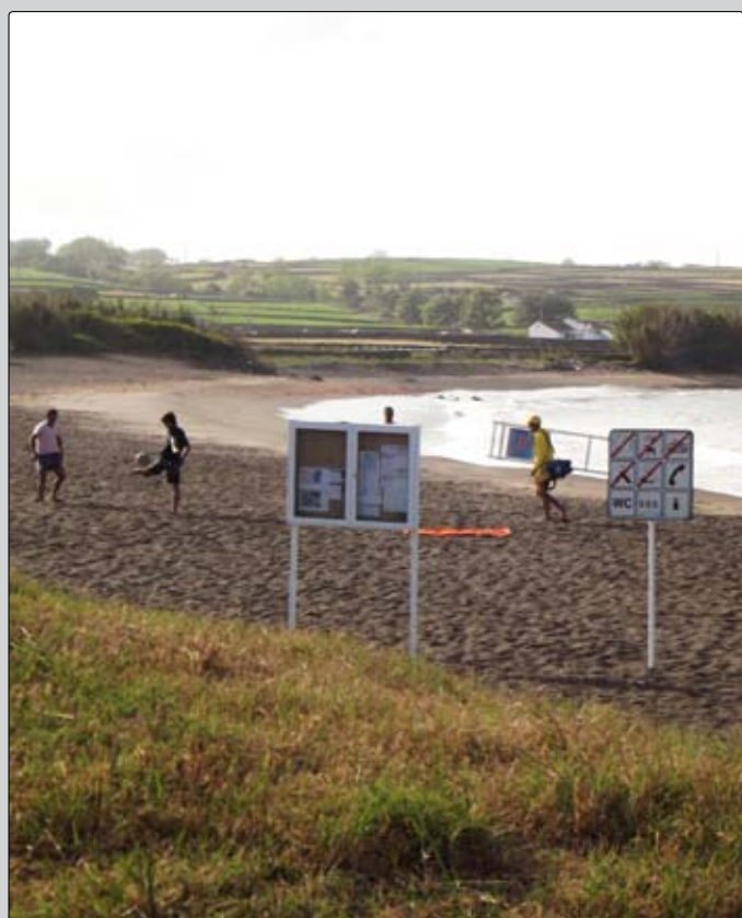
Manutenção de espaços na Praia da Riviera