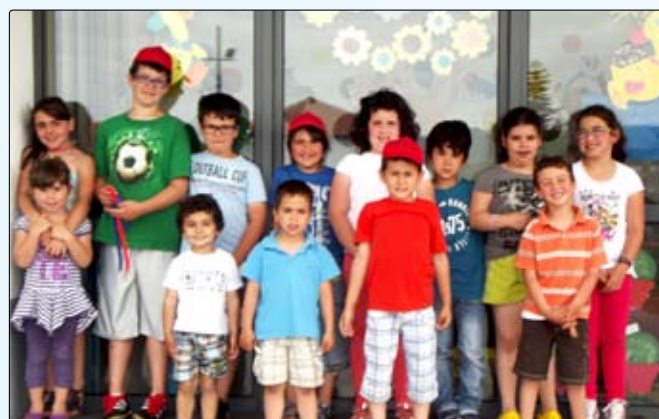
Abertura do Centro Ocupacional (ATL) da freguesia