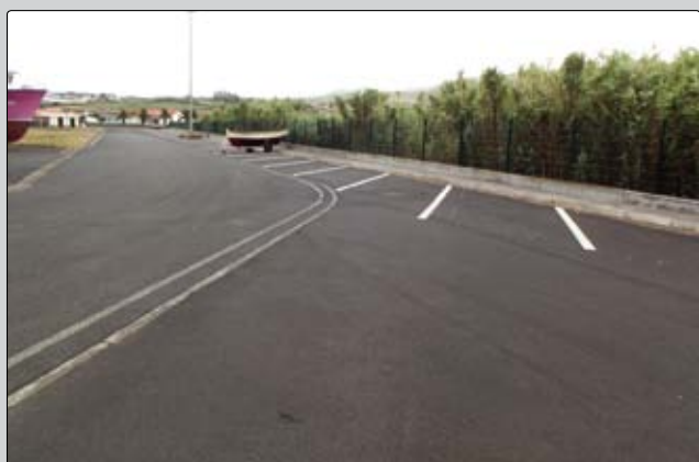
Parque de estacionamento de apoio à Praia da Riviera