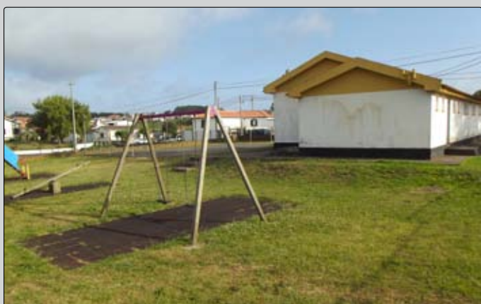
Manutenção da Escola