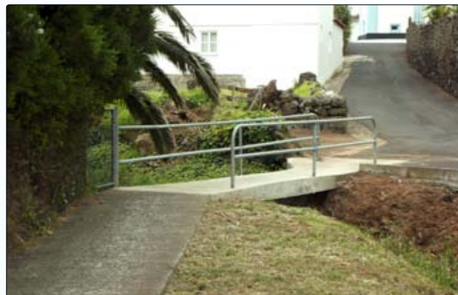
Reconstrução da ponte na Canada da Areia