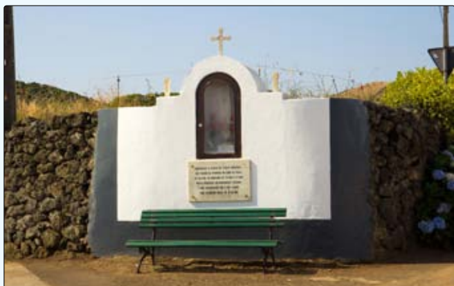
Manutenção do monumento a Nossa Senhora de Fátima