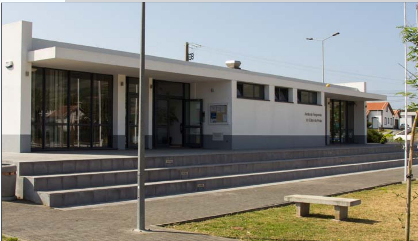
Edifício da Junta de Freguesia