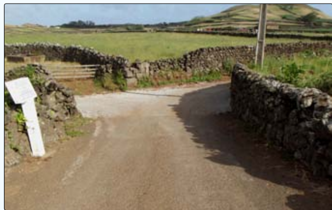
Melhoramento do acesso à Ribeira de Sta. Catarina