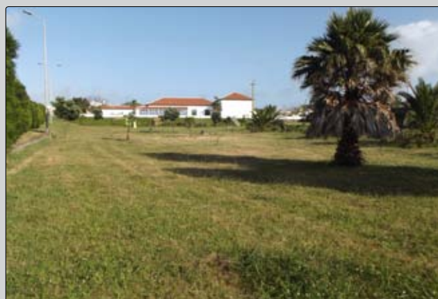
Manutenção de espaços verdes