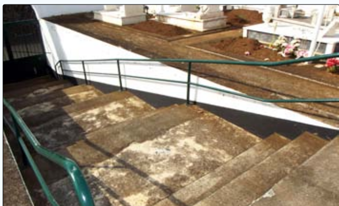
Melhoramento do Cemitério (corrimão, portão e pinturas)