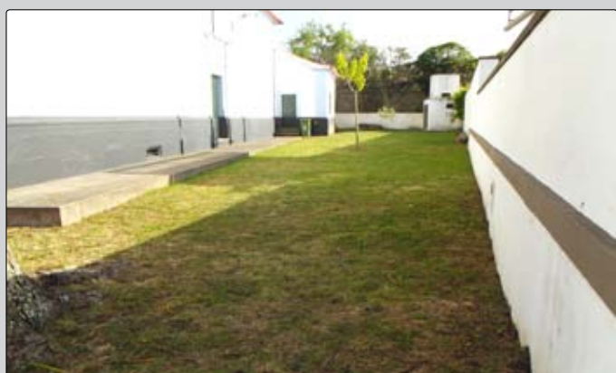
Manutenção de espaços verdes - adro da Igreja