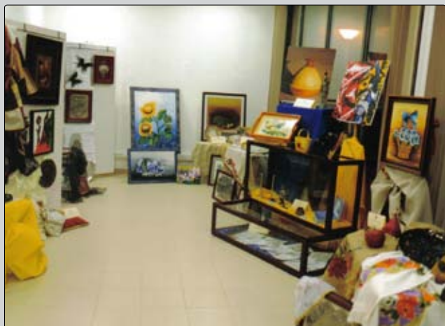
Exposição de Artesãos da freguesia