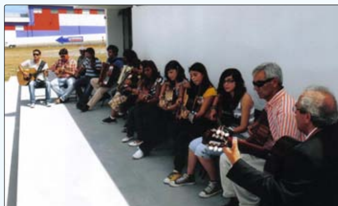
Escola de Formação Musical