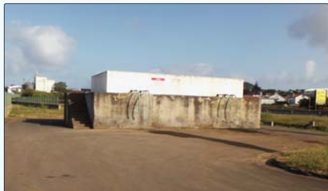
Reestruturação da rede de abastecimento de água para agricultura no Lugar dos Poços