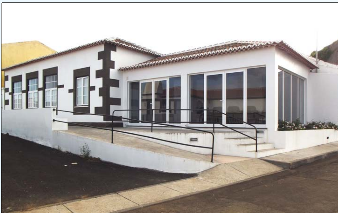
Construção da Casa Mortuária