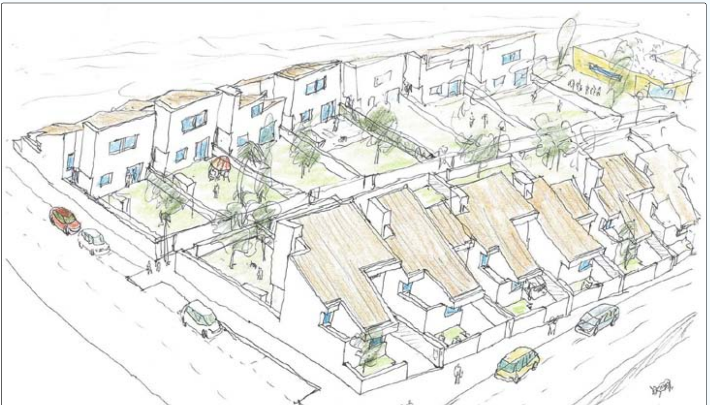
Esquisso da Urbanização de São Brás