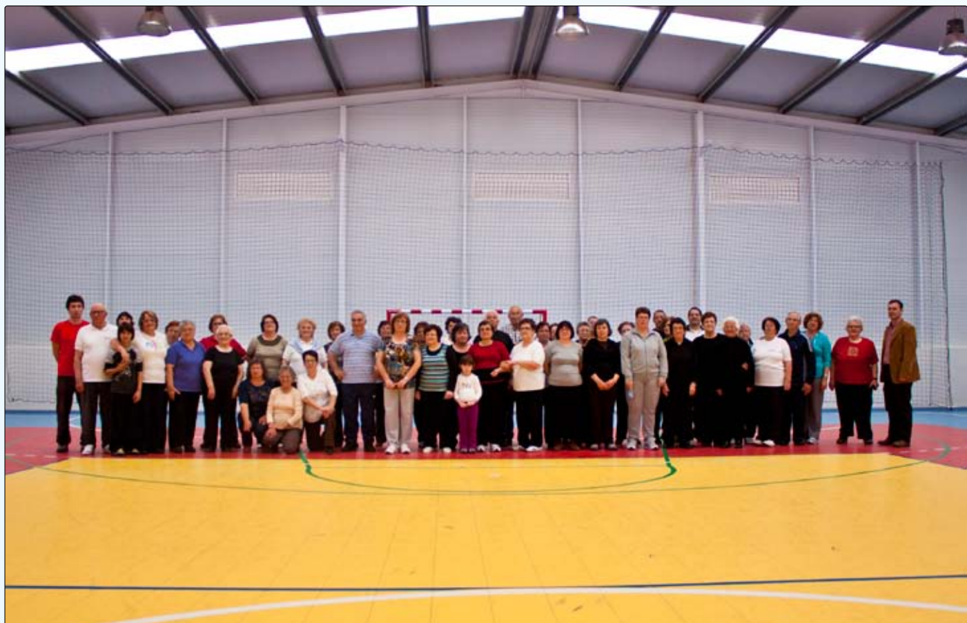
Programa de ginástica para meia e terceira idade em colaboração com a Câmara Municipal