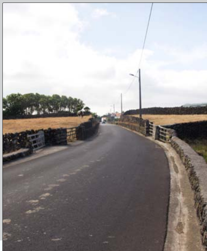
Asfalto, valetas e ligação à rede de água na Rua do Cemitério