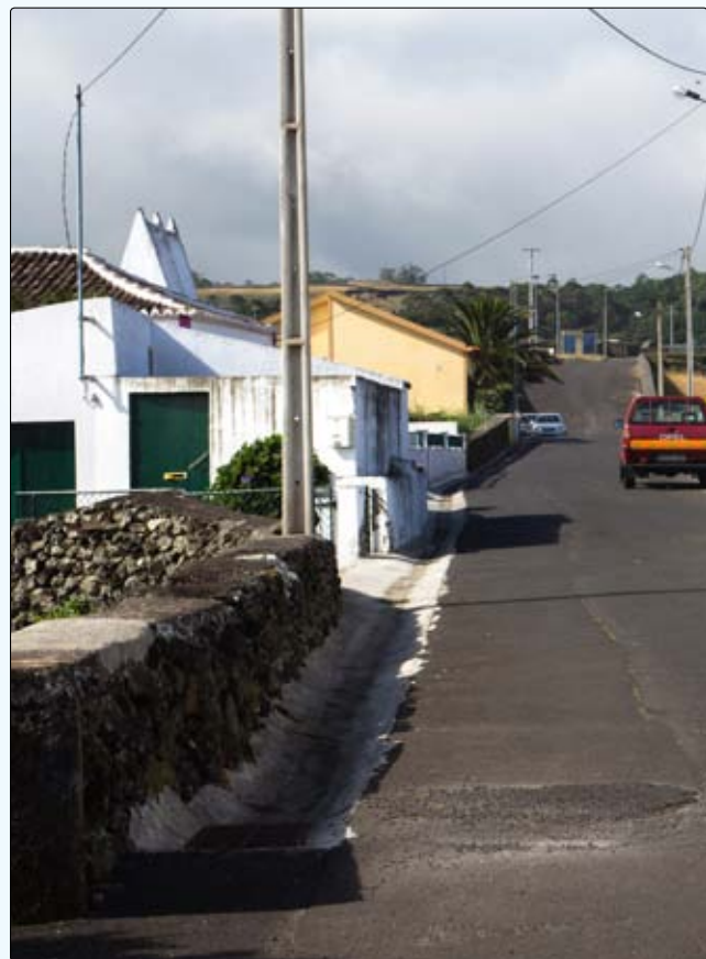
Construção de diversas valetas para escoamento de águas pluviais nas vias da Freguesia