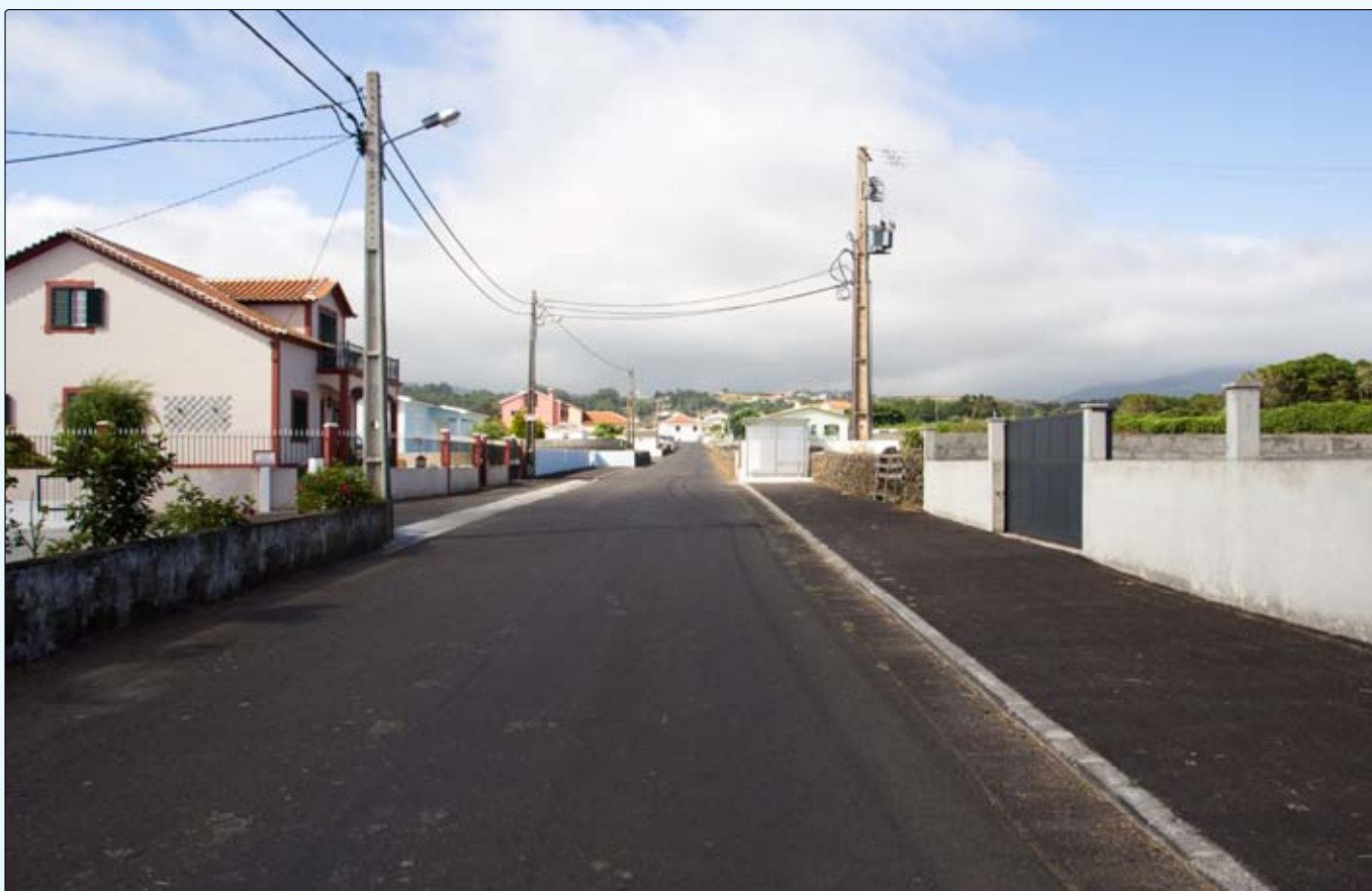
Trabalhos de asfaltagem e melhoramento de sobras de estrada na Freguesia