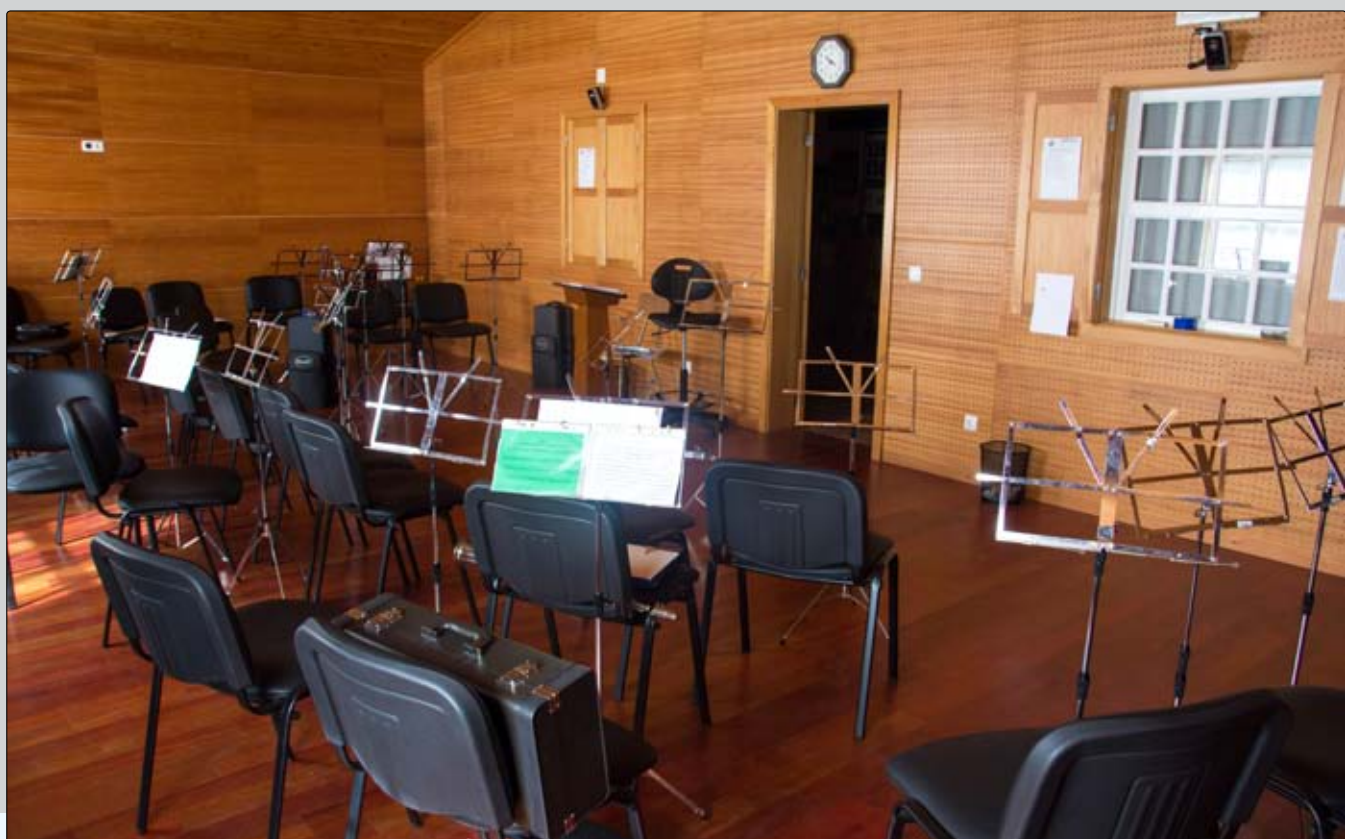
Sala de ensaios da Filarmónica de São Brás