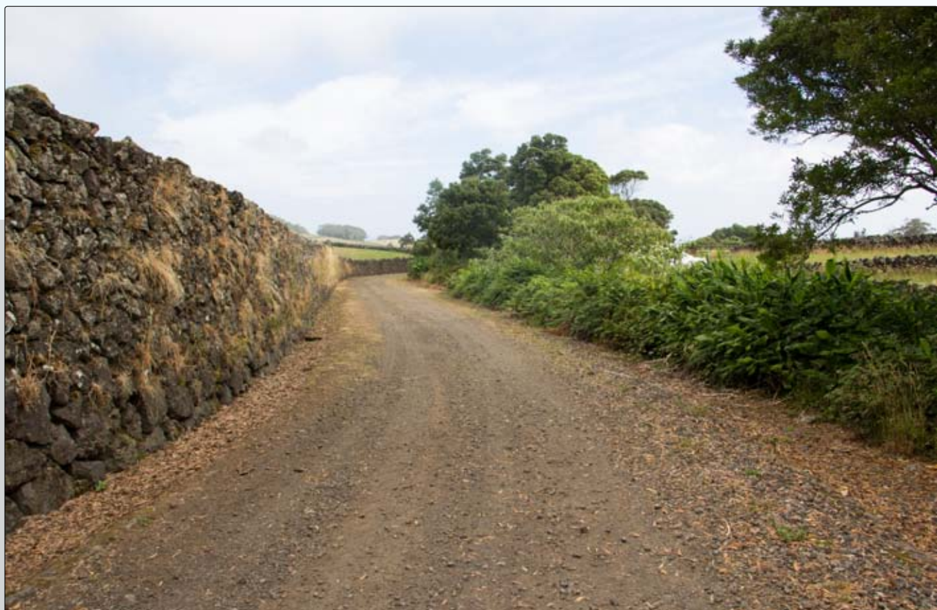
Recuperação do piso na Canada das Ritas