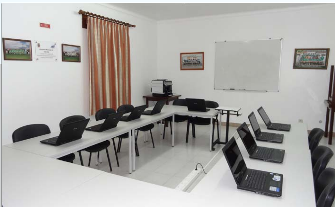
Dinamização do Infocentro de São Brás