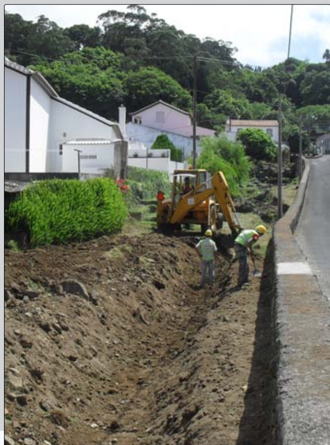
Obra adjudicada de melhoramento do escoamento de água da ribeira na Rua das Covas