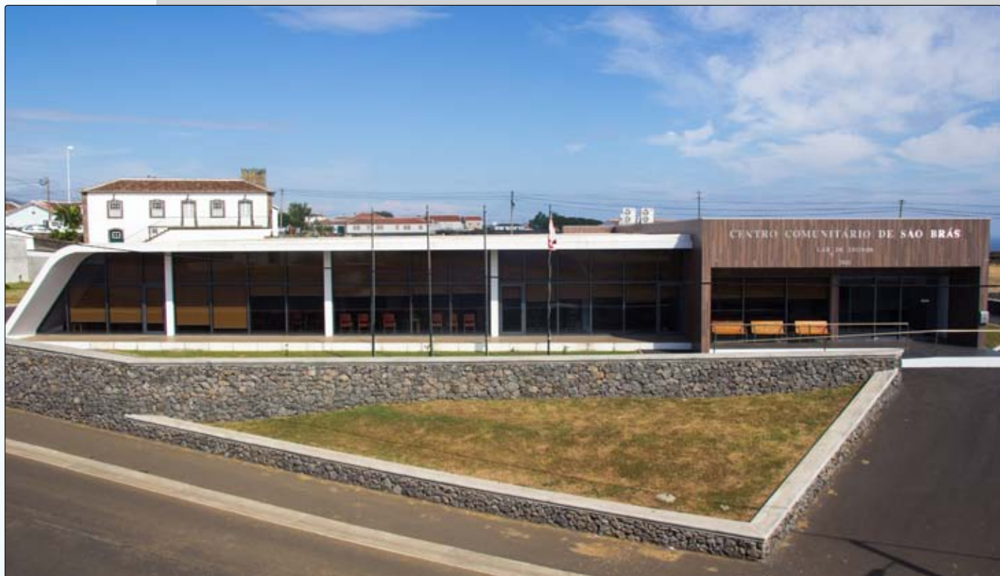
Lar de Idosos de São Brás