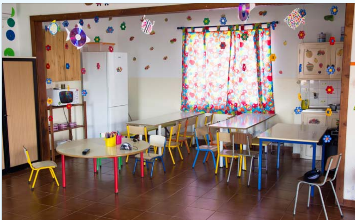
Centro Ocupacional da Freguesia de São Brás