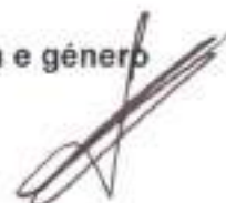
Quadro 15 - Contagem dos dias de ausência ao trabalho durante o ano por cargo / carreira segundo o motivo da ausência e gênero